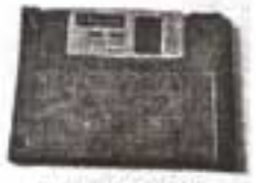
Floppy Disk 3.5

القرص الثين أو المرن هو أحد وسائط تخزين البيانات الممغنطة و في سنة ١٩٦٧ اخترعت شركة IBM أول قرص مرن كان ذو حجم كبير نسبياً يبلغ ٨ بوصات بسعة تخزين بدأت بـ ٨٠ كيلوبايت ثم تطورت حتى ١ ميغا بايت، مما جعل شركة IBM تطوره بعد فترة ليصبح ذو حجم ٥,٢٥ بوصة ويخزن