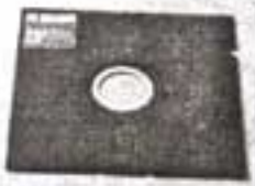
Floppy Disk 5-25