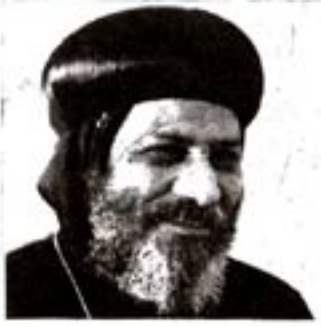
لنيافة الأنبا كيرلس أسقف ميلازو